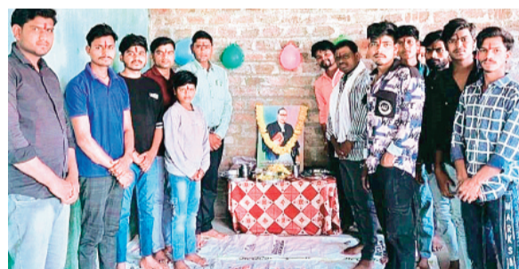
लखनवास