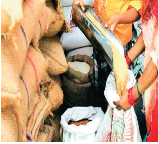
हरिभूमि न्यूज | राजगढ़

सार्वजनिक वितरण प्रणाली (पीडीएस) के तहत जिले के सभी पात्र उपभोक्ताओं को इसी अप्रैल माह में मई एवं जून का भी इकट्ठा राशन देना शुरू कर दिया गया है। विभाग ने सभी राशन दुकानों पर गेहूँ, चावल, शक्कर, नमक आदि पहुंचावा भी दिए हैं। गत 13 अप्रैल से जिले के 12 लाख 89 हजार के लगभग पात्र हितग्राहियों को राशन का वितरण आरंभ करवा दिया गया है।